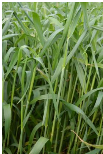
Billedet viser rug ved begyndende skridning i vækststadium 50. Både bladpladen og bladskeden er synlig, og spidsen af stakken er netop synlig. Skal FK organisk stof være over 75,

Læs mere her: www.landbrugsinfo.dk/Kvaeg/Foder .