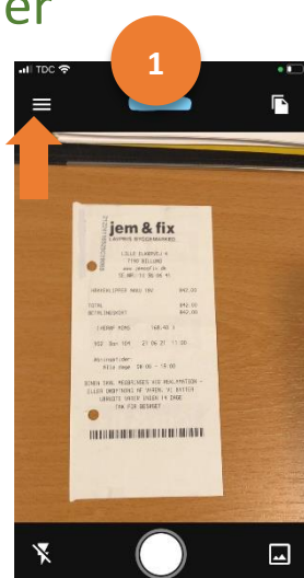
Vælg indstillinger øverst til venstre.